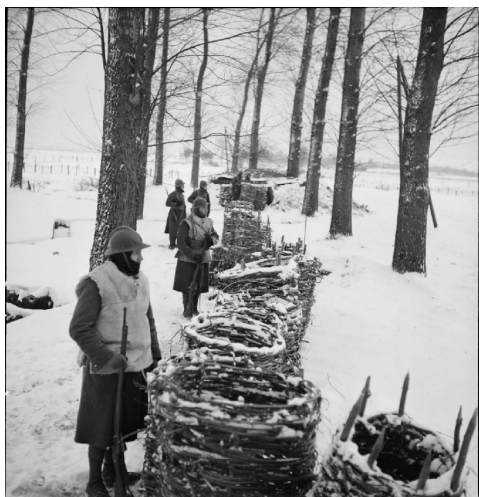
N° 14/ Référence : 2ARMEE 50-B654 Fantassins de la 2 e armée française en poste de surveillance le long de la frontière belge. Janvier 1940