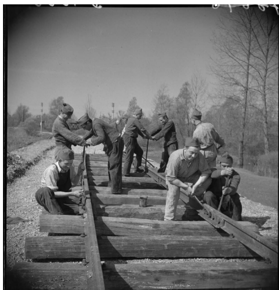
N° 22/ Référence : 2ARMEE 86-B1006 Construction d'une voie pour l'artillerie lourde sur voie ferrée (ALVF) dans le secteur de la 2 e armée française 2 avril 1940

Le commandement peut également confier ces missions aux fantassins, artilleurs ou chasseurs par nécessité ou pour tuer l'ennui.