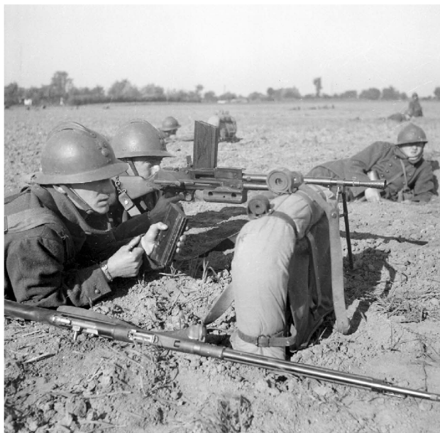
N° 16/ 1ARMEE 6 A20 Soldats du 310 e régiment d'infanterie français à l'entraînement dans le secteur défensif de Lille (Nord). Septembre – décembre 1939