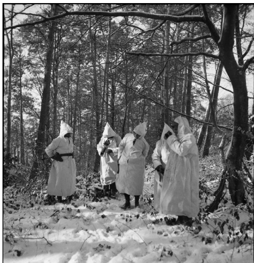
N° 18/ Référence : 5ARMEE 13-E177 Corps franc de la 5 e armée française endossant des survêtements de camouflage sur leur tenue de campagne (Alsace). Hiver 1939-1940