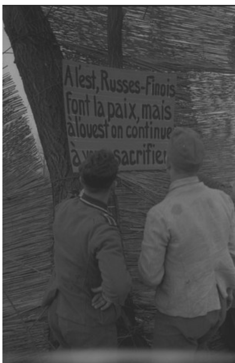
N° 38/ Référence : DAT 1021 L1

Sur la rive allemande du Rhin, des membres de la 670 e compagnie de propagande posent des panneaux indicateurs adressés aux troupes françaises (Allemagne).