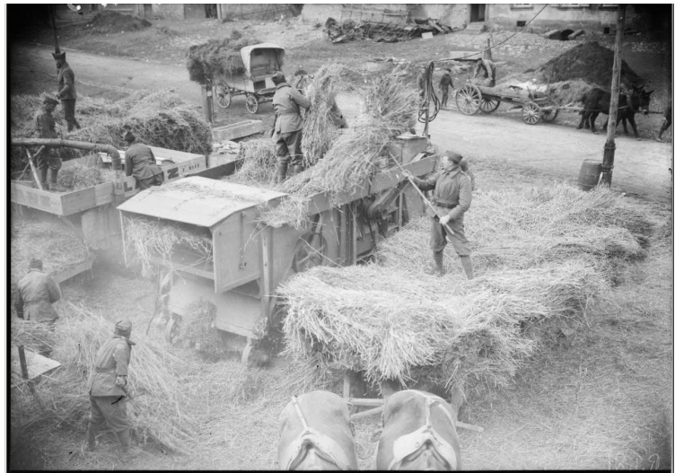
N° 34/ Référence : 4ARMEE 44-D395 Soldats de la 4 e armée française participant aux travaux des champs dans la zone évacuée (Lorraine). Mars - avril 1940