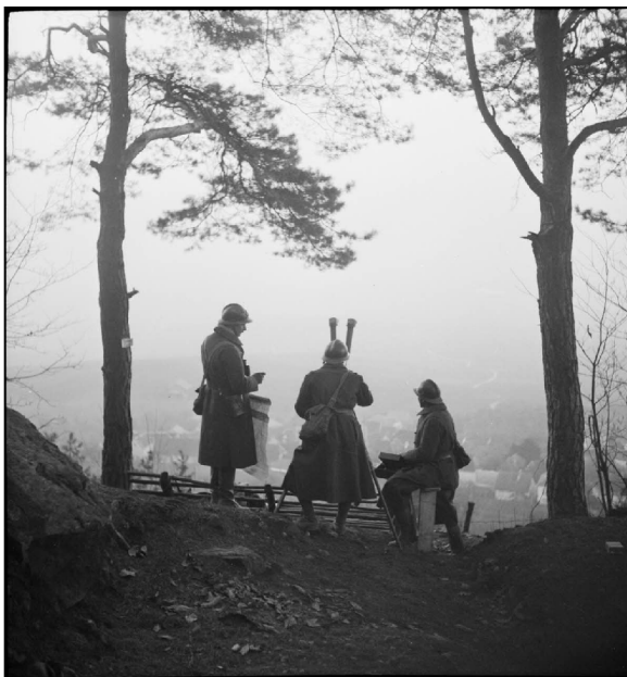
N° 13/ Référence : 8ARMEE 15-H233

Soldats de la 8 e armée française observant la ligne de front équipés de jumelles et d'un binoculaire.