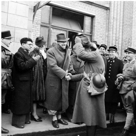
N° 24/ Référence : 8ARMEE 16-H236 Fernandel, Blanche Denège et Andrex rendent visite à la 8 e armée française (Haut-Rhin). Décembre 1939

Les personnalités du spectacle elles aussi viennent voir les soldats, comme Maurice Chevalier, Joséphine Baker, Fernandel, Blanche Denège et Andrex pour distraire la troupe. Ces événements contribuent autant à maintenir le moral des troupes qu'à rassurer la population civile.