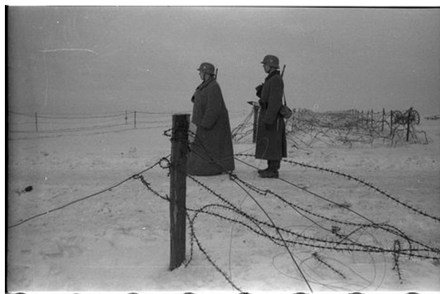
N° 15/ Référence : DAT 933 L3 Sentinelles allemandes sur la ligne Siegfried non loin de Trêves en Allemagne. Hiver 1939-1940

Les peaux de moutons revêtues par les fantassins français sur le cliché n° 14 attestent du froid intense qui règne pendant l'hiver 1939-1940.