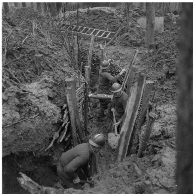
N° 21/ Référence : 4ARMEE 26-D240