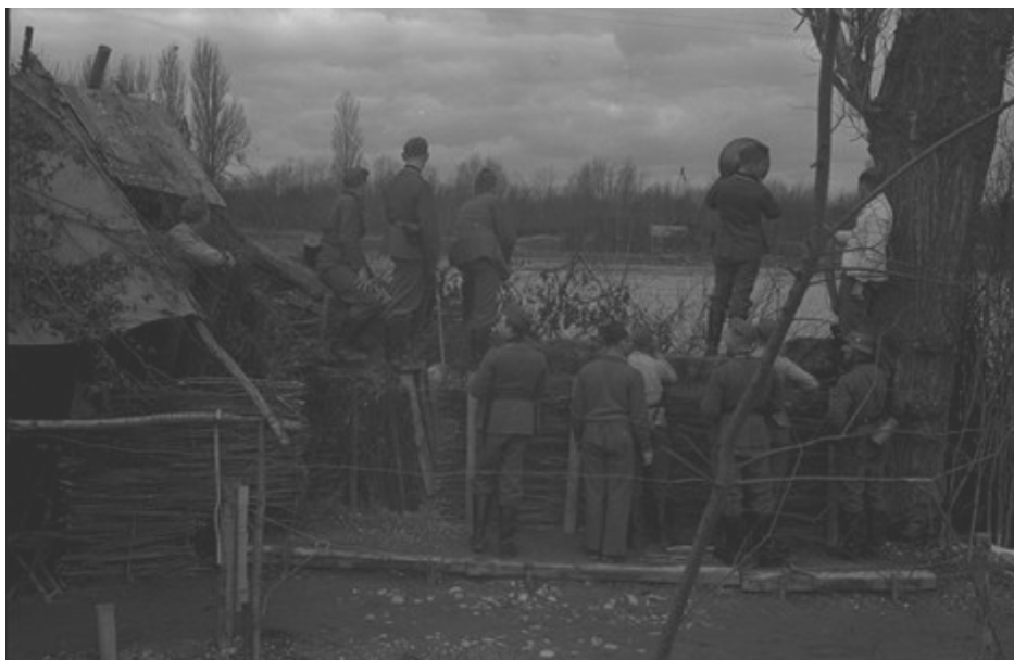
N° 37/ Référence : DAT 1024 L4

Sur la rive allemande du Rhin, des membres de la 670 e compagnie de propagande s'adressent aux soldats français en poste dans les ouvrages de la ligne Maginot (Allemagne).