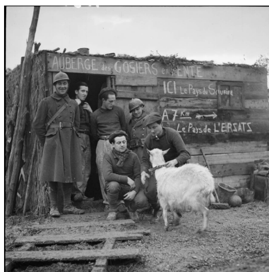
N° 29/ Référence : 3ARMEE 44-C1098 Soldats de la 3 e armée française posant devant une cagna baptisée « Auberge des gosiers en pente » (Moselle). Décembre 1939 - février 1940