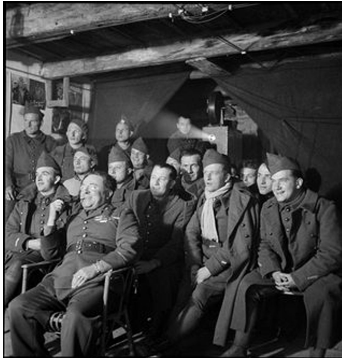
N° 41/ Référence : 2ARMEE 42-B531 Soldats de la 2 e armée française assistant à une séance de cinéma aux armées. Décembre 1939

Le CGI (Commissariat général à l'information) et l'armée française, grâce au SCA (Service cinématographique des armées), collaborent pour mettre sur pied un cinéma aux armées. Les films ainsi réalisés avec l'aval du CGI et l'aide de l'armée sont d'une grande variété et montrent tous, à divers égards, un caractère propagandiste : films d'instruction, films techniques et films documentaires sur la France, films patriotiques et sur les alliés de la France, films sur les origines de la guerre, films sur la France en guerre. A cela s'ajoutent des actualités filmées comme la série du Journal de guerre ou le Magazine de la France en guerre .