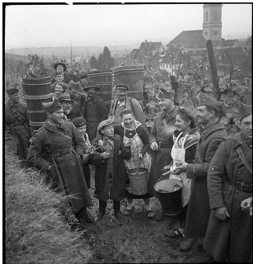
N° 35/ Référence : 8ARMEE 6-H145 Villageois et soldats du 42 e Bataillon de chasseurs à pied se retrouvent pour les vendanges à Riquewihr (Haut-Rhin). Septembre - novembre 1939