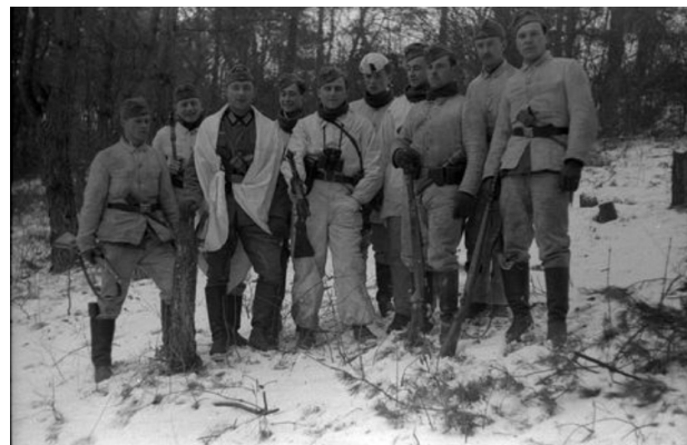
N° 19/ Référence : DAT 966 L3 Portrait de groupe de soldats allemands des Strosstruppen (troupes d'assaut) (Allemagne). Hiver 1939 - 1940