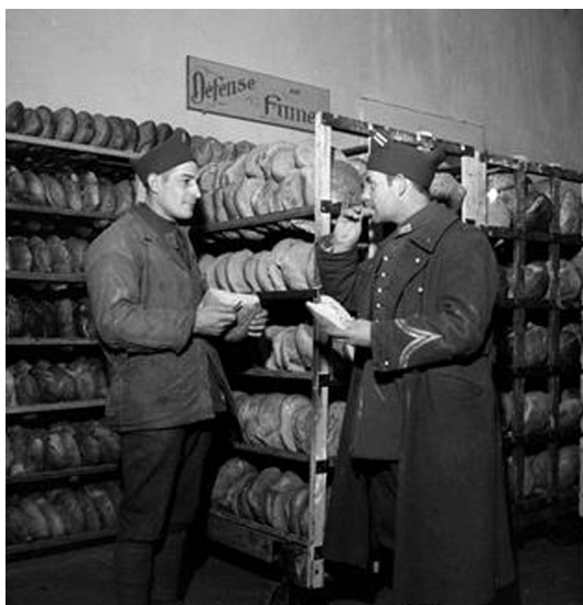
N° 26/ Référence : 2ARMEE 62-B797 Un sergent contrôle le pain produit par une boulangerie de campagne de la 2 e armée. Mars 1940, photographe inconnu