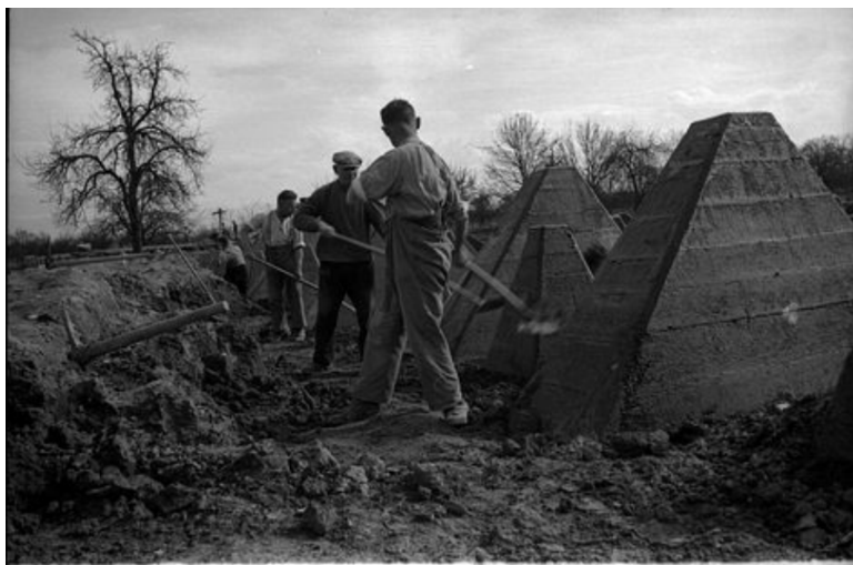
N° 8/ Référence : DAT 1020 L13

Outre Rhin, la ligne Siegfried remplit cette fonction de ligne fortifiée de défense, contre toute agression venant de l'ouest. Son édification débute en 1936 et se poursuit en 1938-1940, face à la ligne Maginot. Appelée Westwall , mur de l'ouest, par les Allemands, elle s'étend de Bâle à Aix-la-Chapelle, sur plus de 630 km, avec plus de 17 000 ouvrages bétonnés et blindés, des tunnels et des dents de dragons. Le Westwall comprend trois ceintures de défense : une première zone d'avant-postes bétonnés répartis sur le terrain ; en lisière, d'importants barrages antichars et des champs de mines ; ensuite un réseau très dense d'ouvrages en béton sur 2 à 3 km de profondeur communiquant entre eux par des souterrains. Cette ligne défensive, comparée par la propagande allemande à la ligne Maginot, mais dont l'efficacité était contestée, fut brocardée dans la chanson de Ray Ventura « On ira pendre notre linge sur la ligne Siegfried », affirmation destinée à remonter le moral des soldats français.