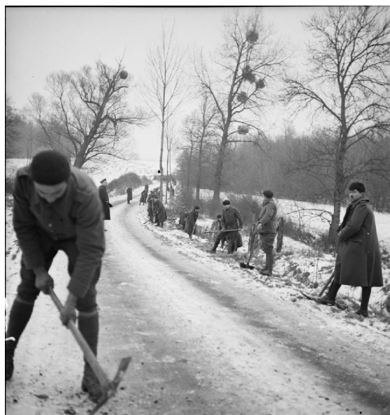
N° 23/ Référence : 2ARMEE 48-B627 Des fantassins de la 55 e division d'infanterie de la 2 e armée française travaillent à la réfection d'une route. Janvier 1940