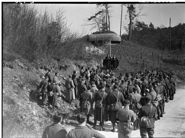
N° 27/ Référence : 5ARMEE 27-E430 Soldats de la 5 e armée française assistant à une messe près d'un ouvrage fortifié de la ligne Maginot (Alsace) Mars – avril 1940, photographe inconnu

La ration quotidienne du soldat au front est de 600 grammes de pain, 350 grammes de viande, 60 grammes de légumes, du lard, du café, du sucre et un demi-litre de vin. Les jours de fête, on ajoute à la ration un « gamelin », gâteau éponyme du général, inventé paraît-il par ses soins.