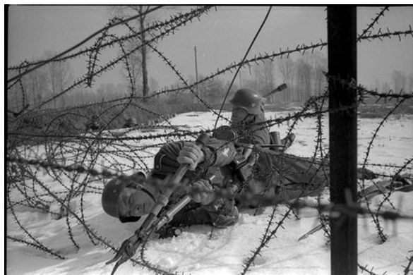
N ° 20/ Référence : DAT 1012 L12

Soldats d'une unité d'assaut allemande simulant une attaque des lignes adverses. Hiver 1939 - 1940