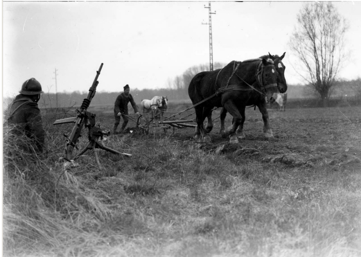
N° 33/ Référence : 5ARMEE 25-E391 Des soldats de la 5 e armée française participent aux travaux des champs en Alsace. Mars 1940, photographe inconnu