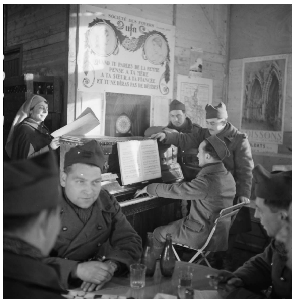
N° 28/ Référence : 2ARMEE 53-B688 Foyer du soldat d'une unité de la 2 e armée (Ardennes). Janvier 1940