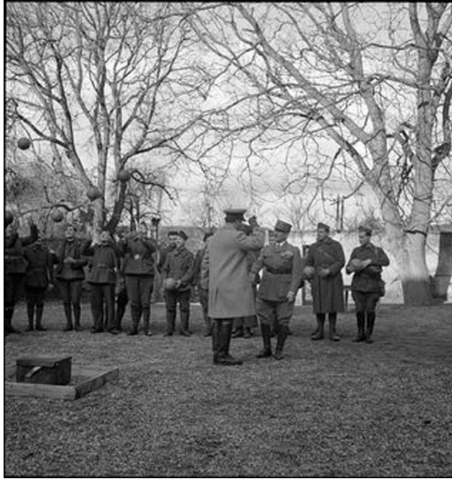
N° 32/ Référence : 4ARMEE 22-D 185

Le général d'armée Requin et un officier supérieur anglais distribuent des ballons de football à des soldats de la 4 e armée française.