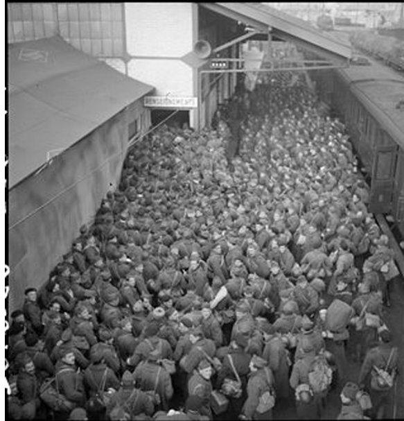
N °36/ Référence : DG 136-2023 Permissionnaires à la gare de Massy (Essonne). Mars 1940

Si certaines permissions dites agricoles sont octroyées, la trêve sur le front permet au commandement d'accorder régulièrement des permissions à la troupe.