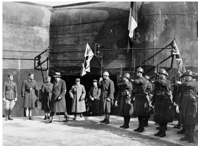
N° 25/ Référence : 4ARMEE 39 – D369 Georges Vanier, ambassadeur du Canada en France visite l'ouvrage fortifié de Kerfent sur la ligne Maginot. Février – mars 1940, photographe inconnu