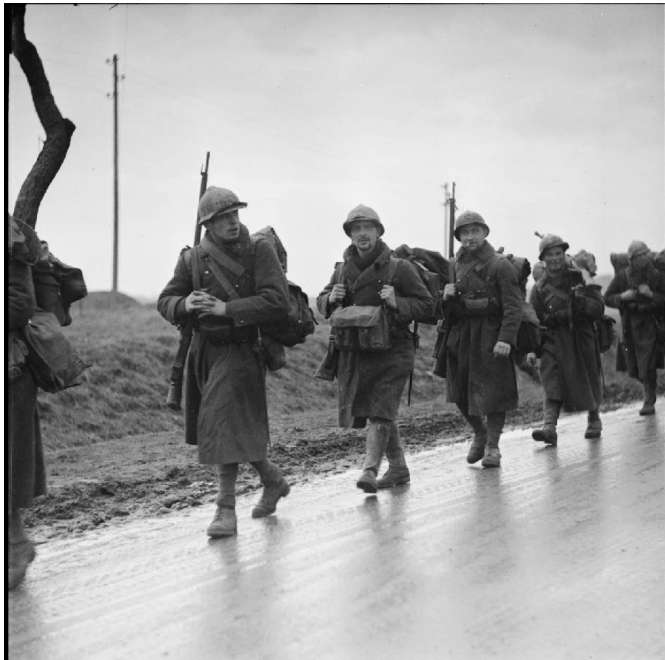
N° 17/ Référence : 3ARMEE 44-C1100 Fantassins de la 3 e armée française patrouillent sur une route de Moselle. Décembre 1939 - février 1940

Durant la drôle de guerre, les soldats effectuent régulièrement des « activités de patrouille », selon la formule consacrée des communiqués publiés dans la presse rendant compte des actions militaires pendant cette période.