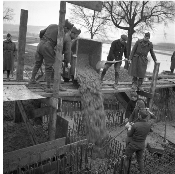
N° 5/ Référence : 2ARMEE 56-B747 Des soldats et ouvriers construisent un ouvrage fortifié de la ligne Maginot en Moselle. Février 1940

La mise en place des fers verticaux très serrés visibles sur le cliché, précède la coulée du béton spécial et atteste l'extrême solidité des ouvrages.