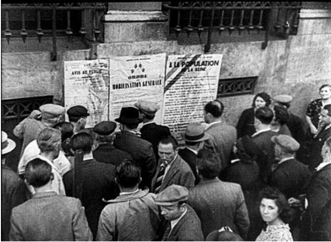
N° 1/ Référence : FT 2326 (photogramme TCI 00 :04 :14 :05)

Foule parisienne prenant connaissance de l'ordre de mobilisation générale en septembre 1939. Septembre 1939, « Magazine de la France en guerre », réalisateur inconnu