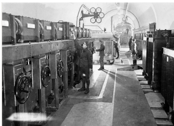
N° 6/ Référence : DG 30-570 Sapeurs du 2 e RG (Régiment du génie) dans l'usine électrique de l'ouvrage fortifié du Hackenberg en Moselle. Décembre 1939 - mars 1940, photographe inconnu

Chaque ouvrage important possède ses propres moyens de production électrique. Les spécialistes électromécaniciens du génie veillent à la bonne marche des installations. Ils s'affairent ici dans la cellule dite de haute tension de l'ouvrage d'artillerie du Hackenberg en Moselle, l'un des deux plus importants de la ligne Maginot.